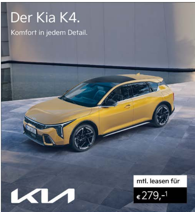
Abbildung zeigt kostenpflichtige Sonderausstattung.

Kraftvoll im Auftritt, großzügig im Inneren und vollgepackt mit innovativer Technologie - der Kia K4 bringt Charakter auf die Straße und aufregendes Fahrgefühl in deinen Alltag. Wähle aus spannenden Motorisierungen und Farben und finde genau den Kia K4, der zu deinem Stil passt. Lerne ihn jetzt bei einer Probefahrt kennen und erlebe, wie komfortabel Kompaktklasse sein kann.