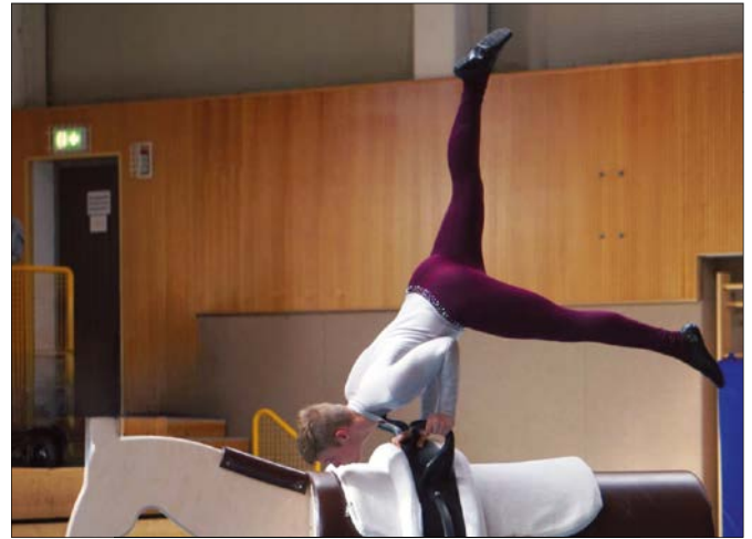
RSG Altkirchen e. V.

Für Verpflegung ist ausreichend gesorgt und die Ostthüringenhalle kann bei jeder Wetterlage besucht werden, sodass einem Tag bei uns nichts mehr im Wege steht.