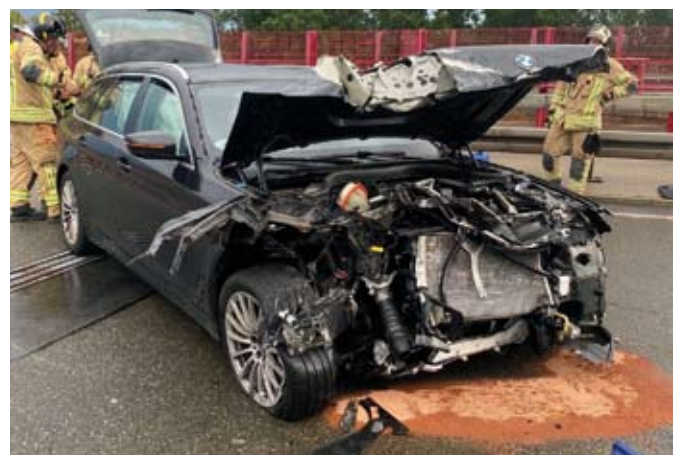
Aufräumarbeiten bei einem der drei Unfälle auf der Autobahn

Fast zur gleichen Zeit am Samstag an der gleichen Stelle: Wieder ein heftiger Regenschauer, wieder ein Unfall. Auch hier banden die Einsatzkräfte auslaufende Betriebsstoffe, sicherten die Einsatzstelle ab und beräumten sie von Trümmern. Und auch am Sonntagnachmittag nochmal das gleiche Spiel: Starker Regen und ein Verkehrsunfall am Kilometer 121 als Folge. Auch hier – sie ahnen es schon – bestand die Aufgabe der Feuerwehr in der Absicherung der Einsatzstelle und dem Binden von auslaufenden Betriebsstoffen. Damit endet der Monat Juli mit Einsatznummer 126.