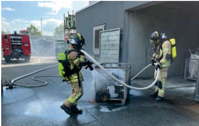
Beim Brand von Metallspänen einer Filteranlage löschen die Kameraden unter Atemschutz das Feuer

In den darauffolgenden drei Tagen galt es jeweils zwei Einsätze abzuarbeiten. Am Montag löste eine Brandmeldeanlage in einem Gewerbebetrieb folgerichtig aus. Abfälle aus einer Filteranlage waren in Brand geraten. Ein Trupp unter Atemschutz konnte den Brand zügig löschen. Bei einem Verkehrsunfall am Nachmittag auf der L1361 Richtung Autobahn wurden drei Personen verletzt. Die Floriansjünger kamen zum Einsatz, um auslaufende Betriebsstoffe zu binden und die Einsatzstelle abzusichern.