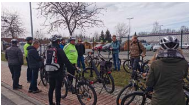
Regel Austausch an der Station Blumenstraße

Gestartet wurde um 09:30 Uhr am Schmöllner Marktbrunnen, die Radtour führte am Brauereiteich vorbei über die Lohsenstraße in den Industrieverbundstandort Crimmitschauer Straße. An sechs Stationen wurde gestoppt und über aktuelle und mögliche Verkehrsführungen diskutiert. Quasi im Selbstversuch erlebten die Teilnehmenden die unterschiedlichen Wegeführungen, teils unmittelbar im Straßenraum, teils auf für den Radverkehr freigegebenen Gehwegen und separaten Radwegen. Potenzielle Gefahrenstellen wurden aus Sicht der unterschiedlichen Nutzergruppen betrachtet. Manchmal reicht schon die Änderung der Beschilderung, um auch Ortsunkundigen bestehende Radwege zugänglich zu machen, die auf den ersten Blick bisher nicht erkennbar sind. Der mitradelnde Mitarbeiter der Straßenverkehrsbehörde nahm entsprechende Lücken in der Beschilderung auf und kümmert sich um Abhilfe.