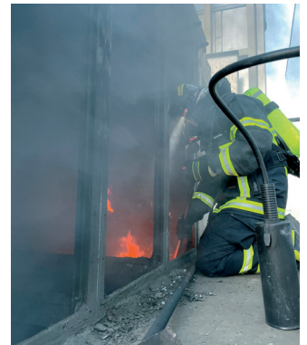
Ein Kamerad im Einsatz unter Atemschutz beim Brand einer Filteranlage

Anschließend wurde die teils brennende Metallstaubmasse entfernt und abgelöscht. Mehrere Trupps unter Atemschutz waren im Einsatz. Insgesamt fünf Stunden dauerte der Einsatz. Zeitgleich wurden im Stadtgebiet drei weitere Einsatzstellen in Zusammenhang mit Sturmtief Ylenia abgearbeitet. In Lumpzig, Selka und Schmölln waren Bäume umgestürzt. Zu guter Letzt galt es dann gegen 21:00 Uhr einen freilaufenden Hund ins Tierheim zu bringen.