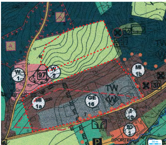
1. und 2. Geltungsbereich der 5. Änderung des Flächennutzungsplans der Stadt Schmölln

Die Geltungsbereiche sind in den nachfolgenden abgedruckten Ausschnitten des Flächennutzungsplanes ersichtlich.