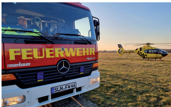
In der Heimstätte landete ein Rettungshubschrauber, abgesichert durch die Feuerwehr.

Der 39. Einsatz in 2022 und gleichzeitig der letzte im Februar führte die Knopfstadttretter am 27. des Monats erneut in die Heimstätte. Dort war es zu einem Unfall im Bereich Skaterpark Crimmitschauer Straße gekommen. Da kein bodengebundener Notarzt verfügbar war, wurde ein Rettungshubschrauber entsandt. Die Aufgabe der Feuerwehr bestand in der Absicherung der Hubschrauberlandung und dem Transport des Notarztes zum Einsatzort.