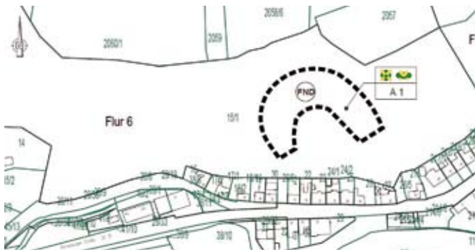
2. Geltungsbereich, Gemarkung Schmölln, Flur 6, Flurstück 15/1 (tw.)