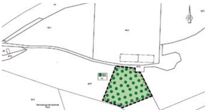
6. Geltungsbereich, Gemarkung Kleinstöbnitz, Flur 1, Flurstück 47/7 (tw.)