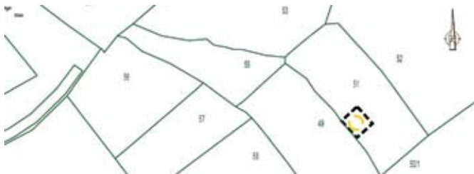
3. Geltungsbereich, Gemarkung Nödenitzsch Flur 1, Flurstück 51 (tw.)