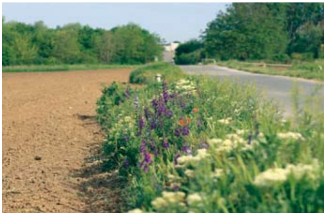
Natura 2000-Station „Osterland“

Außerdem wird ein Leitfaden mit Handlungsempfehlungen erstellt. Erfassungen von Pflanzen, Wildbienen und Schwebfliegen geben Aufschluss über Zustand und Potenzial der Flächen. Ein ehrenamtliches Tagfaltermonitoring ist in den Projektgebieten vorgesehen. Verbände, Vereine, Schulen und Kindergärten können Patenschaften übernehmen. Interessierte wenden sich an Herrn Liebersbach osterland@natura2000-thueringen.de .