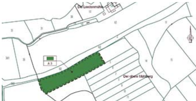
4. Geltungsbereich, Gemarkung Selka, Flur 3, Flurstück 3/1 (tw.); 4/1 (tw.)