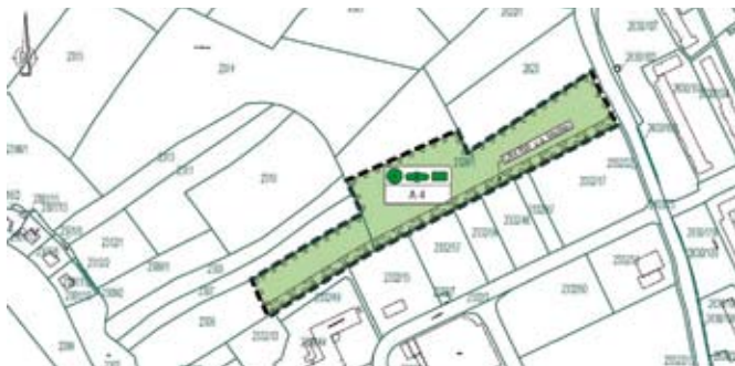
5. Geltungsbereich, Gemarkung Schmölln, Flur 12, Flurstück 2306 (tw.); 2326/1 (tw.)