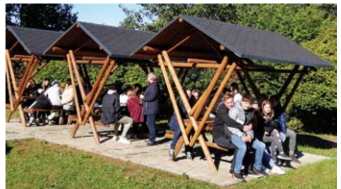
Bildtitel: Beliebter Platz in der Hofpause