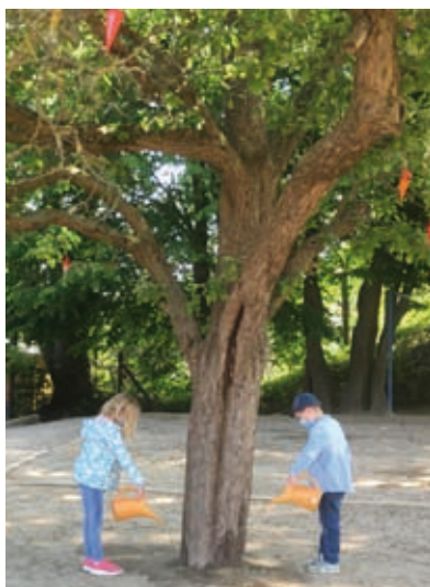
Das Team der Grundschule Altkirchen

Dieses gemeinsame Kennenlernen holen wir hoffentlich in den ersten Schulwochen nach. Ihr müsst auch nicht traurig sein und Angst um eure Zuckertüten haben. An unserem Zuckertütenbaum wachsen bereits kleine Tüten, da die anderen Kinder euren Baum fleißig gießen. Alle wichtigen Informationen für euch finden eure Eltern auf unserer Homepage. Schaut einfach regelmäßig rein.