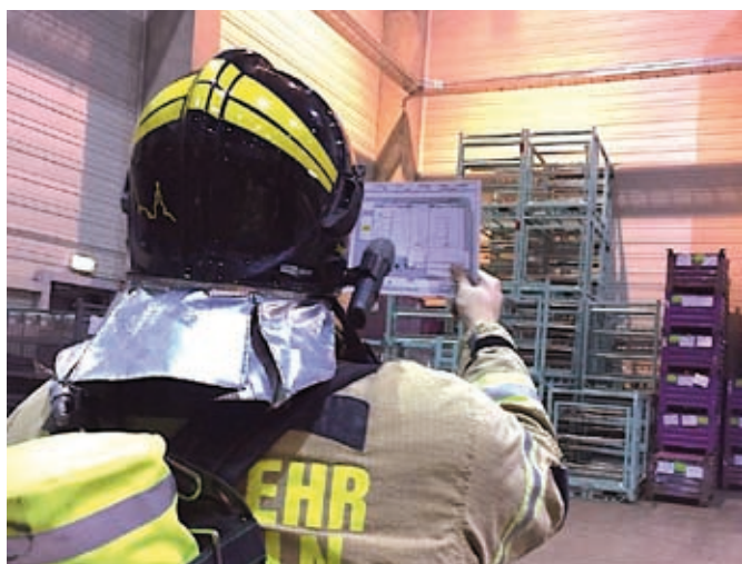
Bei einer eingelaufenen BMA wird mittels einer Laufkarte nach dem ausgelösten Melder gesucht und der betreffende Bereich abgeprüft.

Nach dem alarmierungsarmen Monat April, in dem die Brand- schützer der Knopfstadt zu lediglich sechs Einsätzen gerufen wurden, stieg diese Zahl im Mai auf 13 an. Das Einsatzspek- trum beschränkte sich in diesem Monat auf das ganz normale „Tagesgeschäft“, wie Nottüröffnungen, Tragehilfen für den Rettungsdienst und eingelaufene automatische Brandmelde- anlagen. Gerade diese automatisch auslösenden Brandmelde- anlagen (BMA) ziehen sich wie ein roter Faden durch die Einsatzstatistiken der vergangenen Jahre. Nicht zuletzt auch der positiven Tatsache geschuldet, dass in Schmölln eine Rei- he großer Industriebetriebe ansässig sind. Meist lösen diese Anlagen aufgrund von technischen Defekten, menschlicher Unachtsamkeit oder auch mal umherfliegenden Tauben aus. Dass diese Auslösungen aber auch große Vorteile einer früh- zeitigen Branderkennung besitzen und es sich nicht immer um Fehlalarmierungen handelt, konnten wir schon des Öfteren verzeichnen.