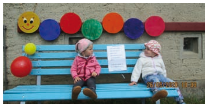
Vielen Dank sagen die Kinder und Erzieher der Kita Lohma! Die Erzieher der Kita „Seepferdchen“, Haus II (Lohma)