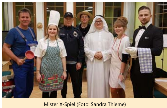
Mister X-Spiel

Als „alte Hasen“ war man bereits bestens mit dem Abendbrot und dem Beziehen der Zimmer und Betten vertraut, sodass auch die obligatorische Belehrung reibungslos ablief.