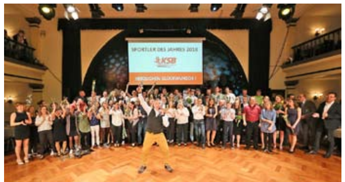
Sportparty 2019

Gefeiert und getanzt werden darf und soll auf der Nacht des Sports natürlich auch ausgiebig. Die COCKTAILBAND als Live-Band und DJ STEFFEN FLASH am Mischpult freuen sich darauf, ab 21:00 Uhr allen Partygästen ordentlich einzuheizen.