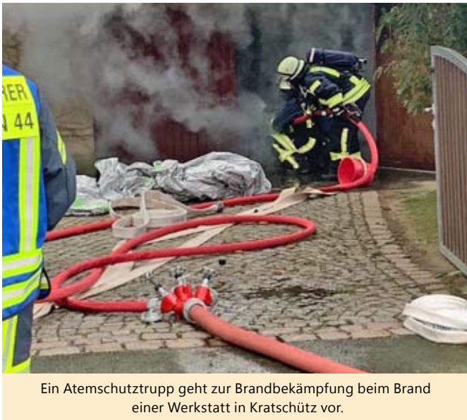
Ein Atemschutztrupp geht zur Brandbekämpfung beim Brand einer Werkstatt in Kratschütz vor.