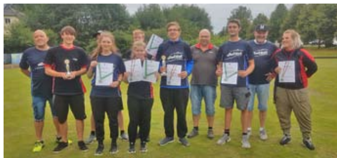
Azubigewinner Dietzel Hydraulik mit Fima Horsch

Das 16. Turnier für „Jedermann“ findet am 11. Juli 2020 wieder auf den Bowlsgreen in Löbichau statt und das 4. Rasenbowlingturnier für Betriebsmannschaften wird am 15. August 2020 ausgetragen. Anmeldungen sind jetzt schon möglich.