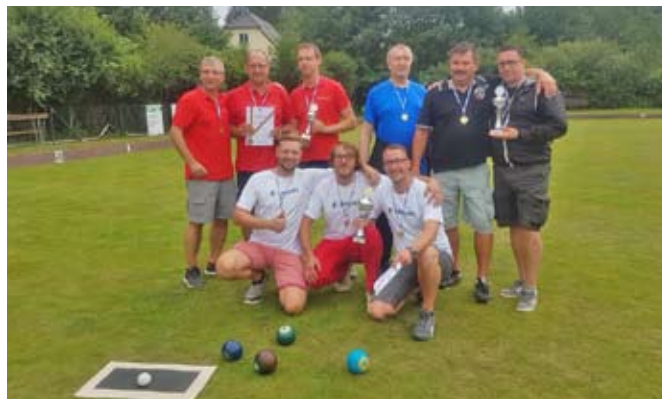
Electronicon (vorn) mit Malerbetrieb Scholz (hinten rechts) und Gugelfuss