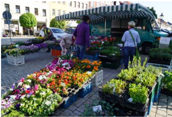
Blumenmarkt 2018

Mit diesem Pflanzenmarkt wollen wir traditionell allen Bürgerinnen und Bürgern aus unseren regionalen Gartenbauunternehmen eine Vielzahl blühender Erzeugnisse präsentieren und eine fachmännische Beratung rund um das Thema Pflanzen zusichern.