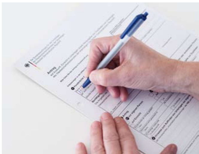
Antragsformular auf Akteneinsicht

Zeit: Dienstag, 21. Mai 2019, 09:00 – 17:00 Uhr Ort: Rathaus Schmölln, Ratskeller, Markt 1, 04626 Schmölln Reinhard Keßler, Leiter der Außenstelle Gera des BStU