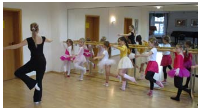
Ballett in der Musikschule Schmölln