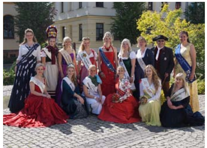
Die Hoheiten aus 2018 beim Besuch des Brückenplatzes

Die Besucher des Marktfestes erwartet außerdem ein aufregendes Programm für Groß und Klein. Für die ordentliche Portion Rhythmus im Blut sorgt die Line-Dance-Gruppe „Black Stetsons“. Spannend geht es außerdem zu bei der Judo-Vorführung des PSV.