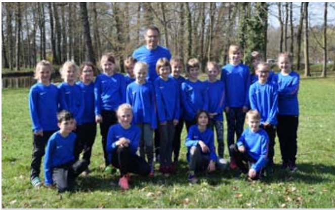
Die Teilnehmer des LSV Schmölln beim Crosslauf in Treben

Bis zu den Osterferien wird es noch den einen oder anderen Crosslauf geben und fleißig weiter trainiert, so dass am 5. Mai 2019 mit dem Osterlandmeeting des LSV auf dem Schmöllner Pfefferberg die Stadionsaison starten kann.