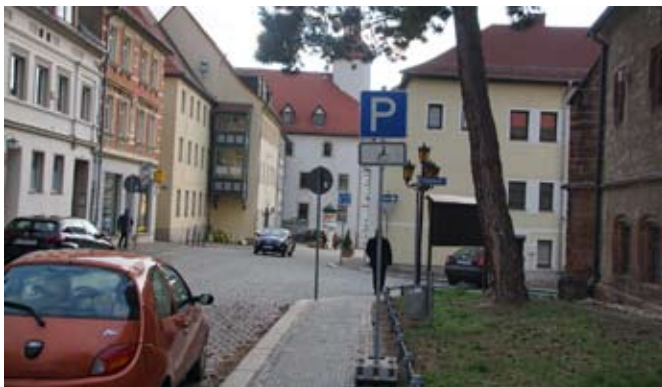
Aktuelle neue Fläche für den Behindertenparkplatz

Dieser Behindertenparkplatz befindet sich nun auf der anderen Seite der Kirche, in der Gößnitzer Straße.