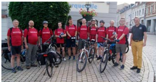
Die Fahrrad-Delegation 2018 vor dem Start der Tour nach Žďár nad Sázavou (Tschechien)

Aktuell werden für diese Radreise noch zwei, drei weitere Mitfahrer gesucht, die sich der Schmöllner Delegation anschließen wollen.