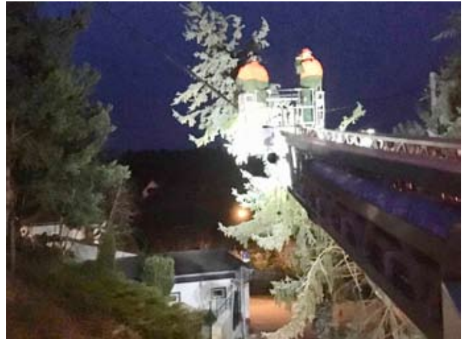
Im Scheinwerferlicht der Drehleiter muss bei diesem Einsatz ein Nadelbaum aus einer Telefonleitung geschnitten werden

Ein einsatzreicher Monat März liegt hinter den Schmöllner Kameraden. Insgesamt wurden die Freiwilligen zu 37 Einsätzen alarmiert. Einsatzschwerpunkt bildete eine Sturmwetterlage um das Wochenende 9. und 10. März 2019, als das Tief „Eberhard“ unsere Region überquerte. 17 Alarmierungen mussten an diesem und den darauffolgenden Tagen abgearbeitet werden, bei denen überwiegend umgestürzte Bäume und abgebrochene Äste beseitigt wurden. Betroffen waren insbesondere die Stadtteile Weißbach, Brandrübél, Sommeritz und Großstöbnitz sowie das Stadtzentrum.