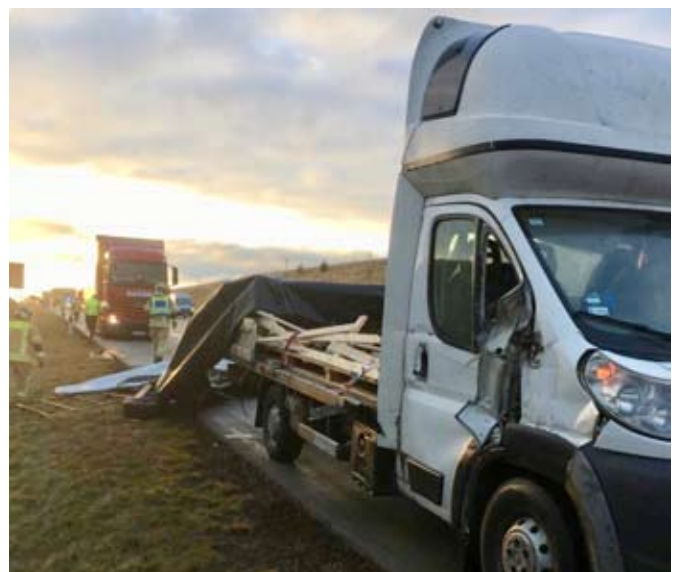
Dieser Transporter wurde bei einem Unfall auf der BAB 4 am 12.03.2019 stark beschädigt, Personen wurden nicht verletzt

Ein Verkehrsunfall zwischen einem Transporter und einem LKW ereignete sich in den Morgenstunden des 12. März 2019 auf der Bundesautobahn 4 in Richtung Eisenach. Um 06:45 Uhr wurde die Freiwillige Feuerwehr Stadt Schmölln alarmiert. Der Transporter-Fahrer hatte durch eine Unachtsamkeit einen neben ihm fahrenden LKW touchiert. Dabei wurde der Planenaufbau des Transporters abgerissen. Die Kameraden kamen zum Einsatz, um die Trümmerteile einzusammeln und zu sichern. Um 08:00 Uhr war der Einsatz beendet.