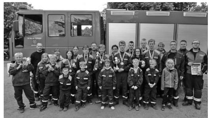
Jugendfeuerwehr Dobitschen /Göhren/Lumpzig

an unsere Jugendfeuerwehr für das erfolgreiche Abschneiden beim Jugendzeltlager in Pahna.