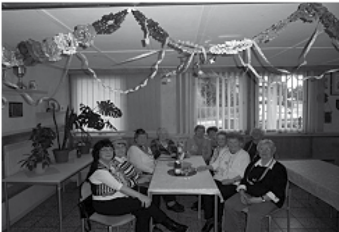
Die fünfte Jahreszeit ist nun vorbei. Die Senioren erfreuten sich in gemütlicher Runde bei Kaffee und leckeren Pfannkuchen.

Es war eine schöne Zeit in der Begegnungsstätte Starkenberg, ich möchte mich recht herzlich bei meinen treuen Besuchern bedanken und wünsche Ihnen „Frohe Ostern“.