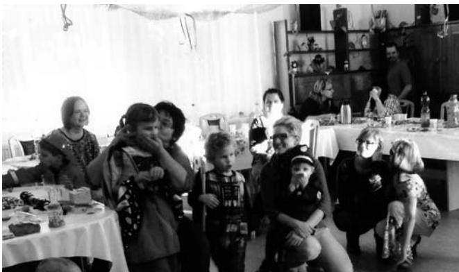
Ein gut besuchter schöner Kinderfasching und Seniorenfasching in der Begegnungsstätte Großröda