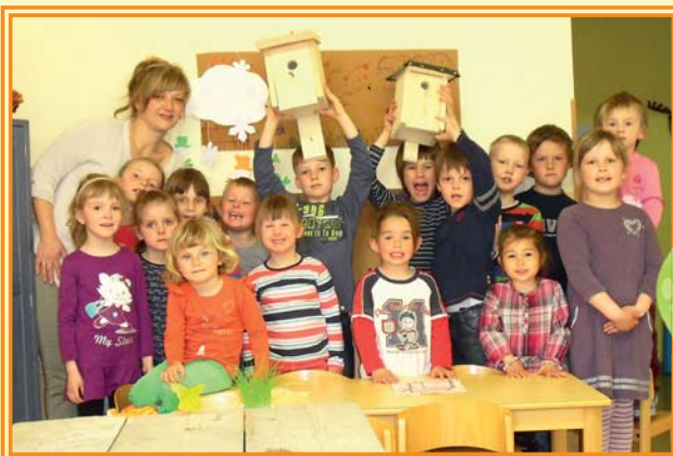
Kindergarten „Zwergenrevier“ Lumpzig