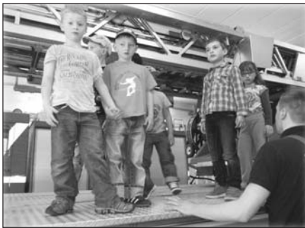
Die Vorschule des Kindergartens Sternchen