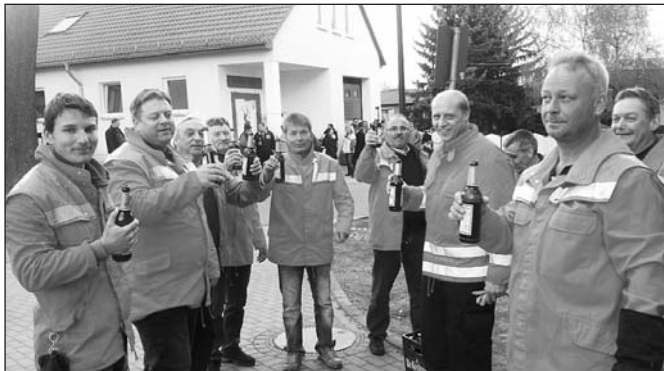
Feuerwehrmänner beim Durstlöschen nach dem Maibaumsetzen.

Viele Bürger der Gemeinde fanden sich am Vorabend des 1. Mai vor dem Feuerwehrhaus in Göllnitz ein, um das traditionelle Setzen des Maibaumes durch die Kameraden der Freiwilligen Feuerwehr zu verfolgen. Spiele mit süßen Überraschungen, ein kleiner Fackelumzug und ein Hexenfeuer erfreuten besonders die Kinder. Die Versorgung mit Speisen und Getränken erfolgte wie immer durch den Feuerwehrverein.