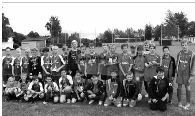
Teilnehmer am Fußballturnier der E-Junioren

Am Sonntagvormittag gingen die Fußballer der E-Junioren mit ihrem Turnier an den Start, bei dem sich die Jungs und Mädels aus Schmölln vor den Mannschaften aus Nöbdenitz und Altkirchen durchsetzten.