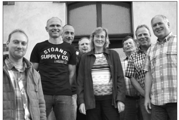
Der neue Gemeinderat mit Bürgermeister nach seiner konstituierenden Sitzung am 16.06.2014.

Ich gratuliere allen Kandidaten zur Wahl in den neuen Gemeinderat. Ich freue mich auf eine konstruktive und fruchtbare Zusammenarbeit.