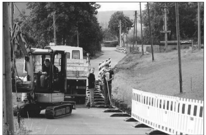
Straßenbeleuchtung wird in Großtauschwitz erneuert.