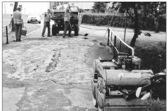
Kommunalarbeiter beim beseitigen der Winterschäden.