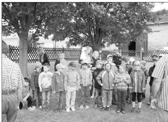
Die Ferienkinder und Horterzieherinnen der Grundschule Altkirchen

Ein großes Dankeschön an dieser Stelle an alle, die uns bei diesen schönen Ferienerlebnissen tatkräftig unterstützt haben.