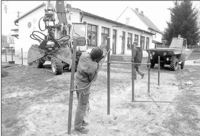
Unsere Kommunalarbeiter bereiten Flächen für neue Spielgeräte im Kiga Röthenitz vor.