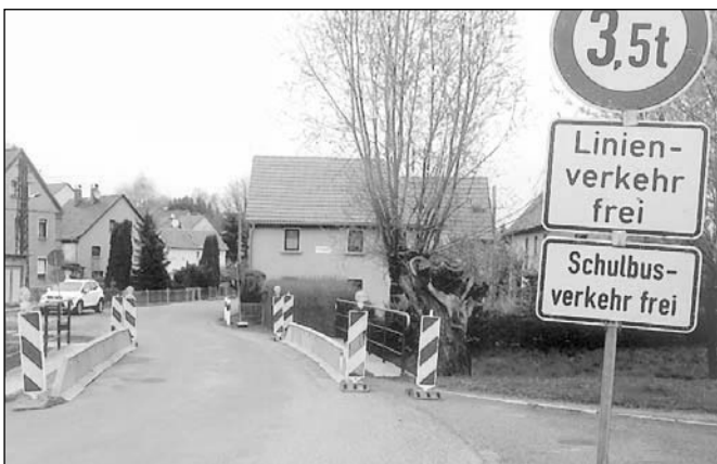
Die bereits im Amtsblatt April angekündigte Nutzungsbeschränkung!